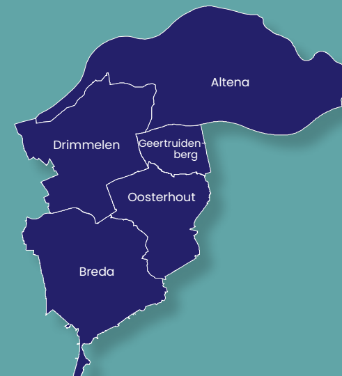
Kaart van regio West Brabant Oost

Waar voorheen jeugdhulpverlening het voortouw nam bij het maken van een plan van aanpak, is dat nu anders. Eerst zoeken we naar een vertrouwenspersoon voor de jongere. Deze JIM krijgt de lead. Het is van essentieel belang om iemand te vinden waar de jongere vertrouwen in heeft. Die vertrouwenspersoon kan meer tot stand brengen dan hulpverleners.