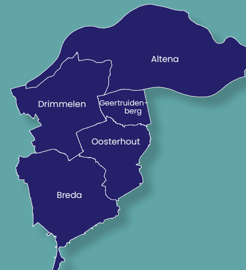
Kaart van regio West Brabant Oost

Waar voorheen jeugdhulpverlening het voortouw nam bij het maken van een plan van aanpak, is dat nu anders. Eerst zoeken we naar een vertrouwenspersoon voor de jongere. Deze JIM krijgt de lead. Het is van essentieel belang om iemand te vinden waar de jongere vertrouwen in heeft. Die vertrouwenspersoon kan meer tot stand brengen dan hulpverleners.