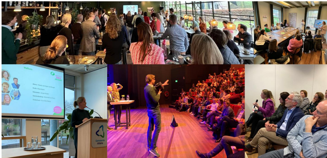
Foto-impressie van de consultatiefase

De consultatiefase startte op 9 maart met een bijeenkomst voor medewerkers van de vijf gemeenten, ondertussen hebben ook de eerste bijeenkomsten met de gemeenteraden en aanbieders plaatsgevonden. De planning van komende en verslagen van eerdere bijeenkomsten vindt u op de website van WBO. Heeft u vragen over dit proces stuur dan een mailtje naar programmasecretarisNVO@breda.nl